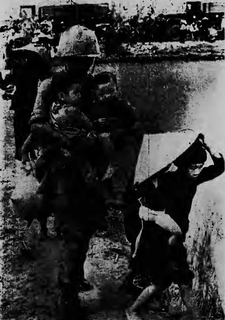
Un soldá Coreano ta cargando dos mucha chikito di Vietnam pa crusa un plantacion di arroz. Esaki tabata parti di e evacuacion di 600 refugiado for di un sector cu nan a plama tur na bom despues.